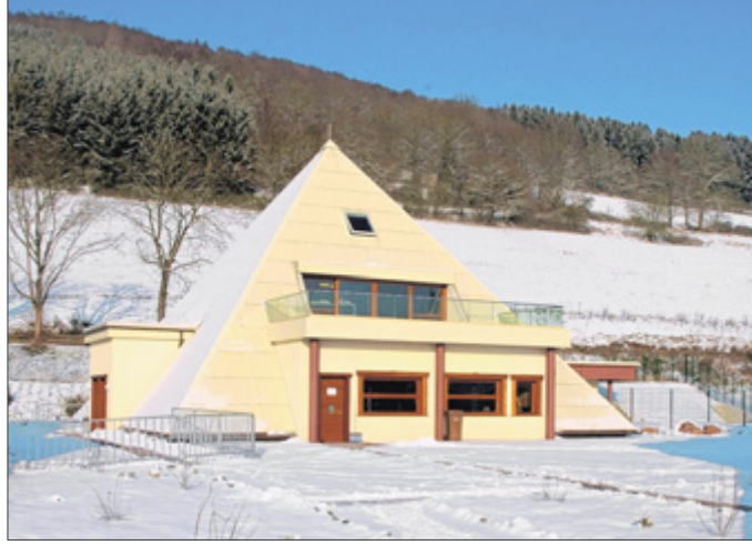
Pyramiden im Schnee – ein eher ungewöhnlicher Anblick, allerdings nicht in Meggen.

Ende Oktober 2009 wurde der sauerländische Unterneh-