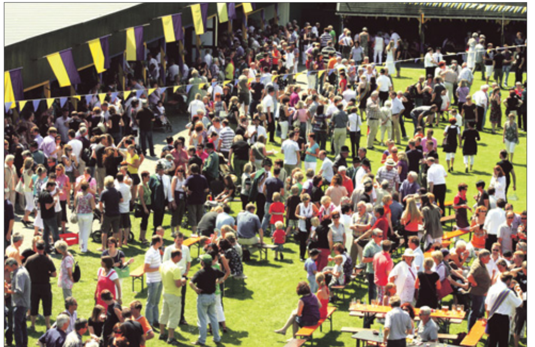
Schon beim Vogelschießen ist der Schützenplatz in Bad Berleburg am Samstagmittag gut gefüllt. Die Menschen wollen eben dabei sein, wenn der neue König bejubelt wird.