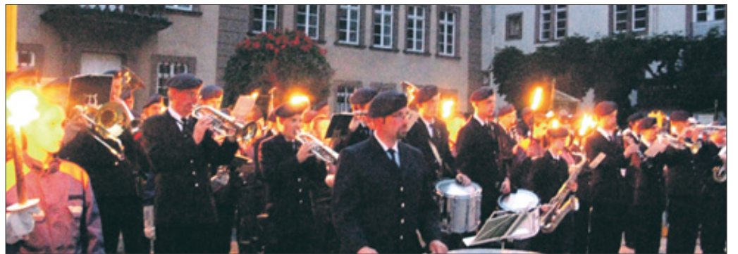
Der große Zapfenstreich auf dem Schlosshof zählt zu den Höhepunkten des ersten Tages beim Berleburger Schützenfest. Das anschließende Mitternachtsfest findet in diesem Jahr erstmals auf dem Goetheplatz statt.