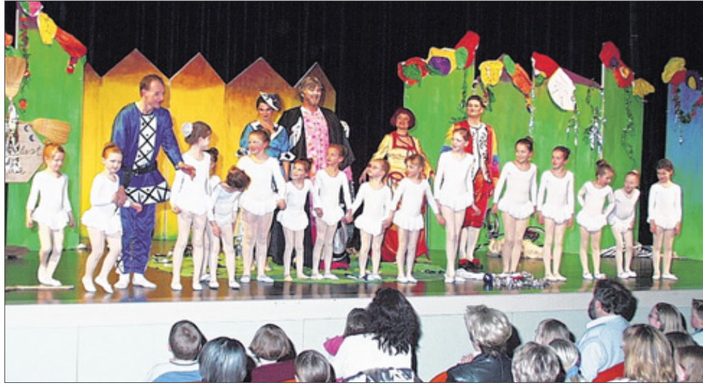
Das Archivbild zeigt eine Szene aus einem Kindermusical auf der PZ-Bühne.

Die Entstehungsgeschichte des PZ beginnt bereits im Jahr 1974. Damals gab es erste Überlegungen zur Errichtung einer