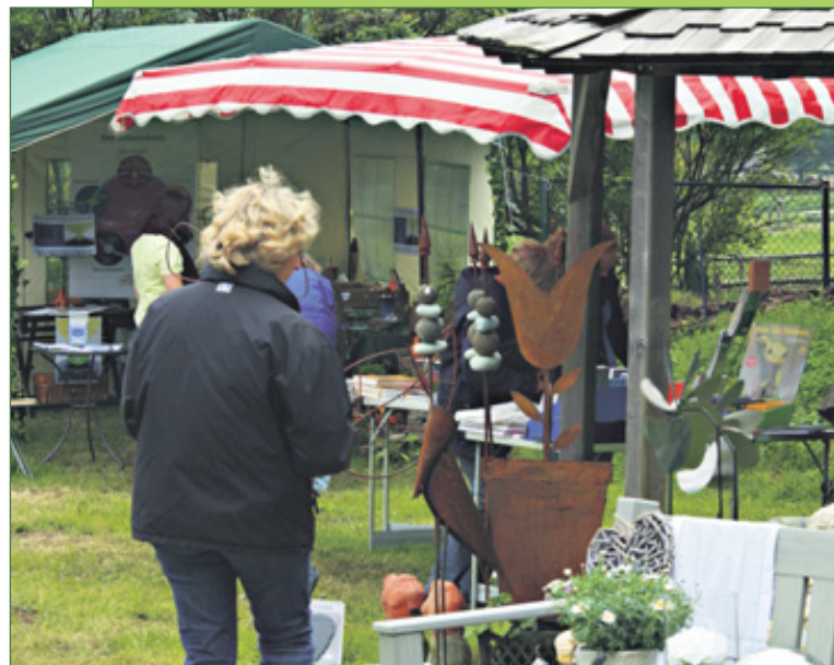
VERWEILEN, PLAUDERN UND GENIEßEN: WAS DIE KRÄUTERKÜCHE BEREITHÄLT, ERFREUT JEDEN GAUMEN.