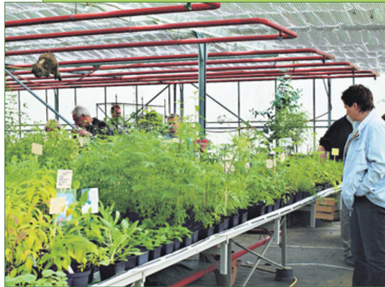
DIE TÜREN ZUM GEWÄCHSHAUS UND GARTEN SIND WEIT GEÖFFNET: 450 KÜCHEN-, HEIL- UND DUFTKRÄUTER BILDEN DEN RAHMEN DES GESCHEHENS.

Wir alle wünschen Ihnen und uns vier spannende, schöne und erquickliche Tage!