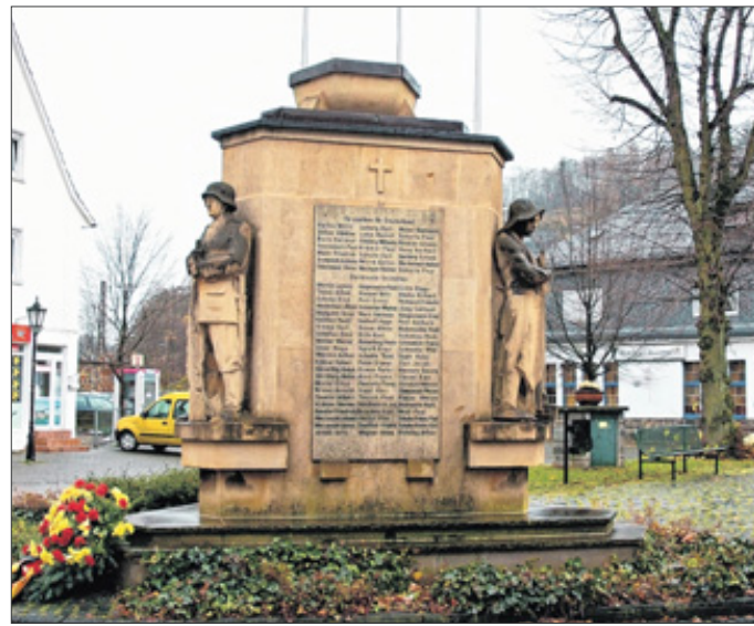
Hier werden viele kleine Osterfeuer brennen.

Der Heimatverein, der übrigens in diesem Jahr sein 25. Jubiläum feiert, stellt hier kleine Schwedenfeuer auf, die im Kreis um ein größeres Feuer stehen, das in einer großen Schale aus Metall entzündet wird. Bis vor vier Jahren wurden auch in Meggen große Osterfeuer abgebrannt. Auf dem ehemaligen Osterfeuerplatz stehen aller-