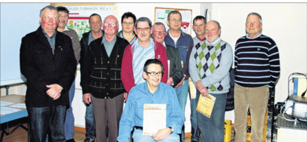
Zahlreiche Jubilarehrungen gab es bei der Generalversammlung des TV Rönkhausen 1892.

Rönkhausen. Hohe Ehrungen von langjährigen und verdienten Vereinsmitgliedern sowie turnusmäßige Vorstandswahlen standen im Mittelpunkt der Jahreshauptversammlung des Turnverein Rönkhausen 1892 am Freitagabend im Sportler-treff Rönkhausen.