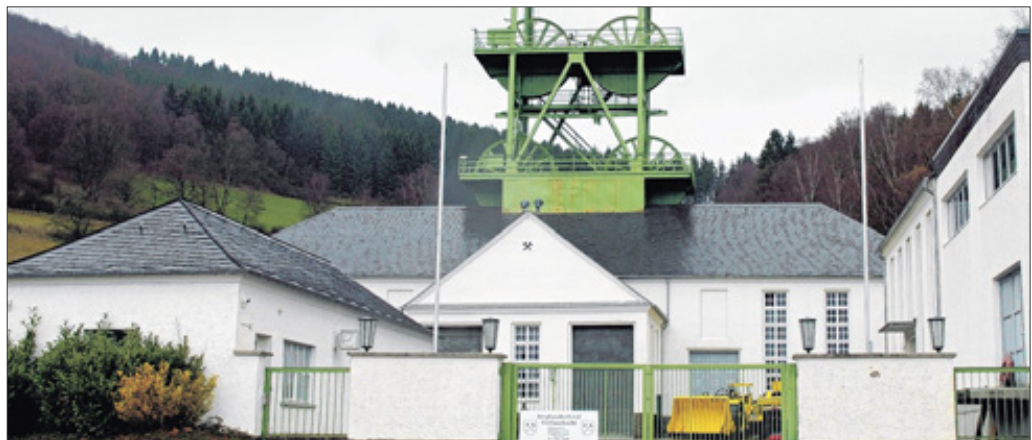
Das große Fördergerüst ist heute Teil des Bergbaumuseums und auch aus der Tallage nicht zu übersehen.

Meggen stellt seine Bergbauergangenheit vor – im Museum „Siciliaschacht“