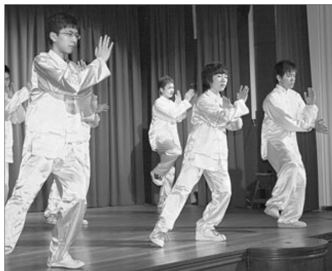
Die chinesischen Schüler präsentieren in der Aula des SFG Tai Chi, eine Form des Kung Fus.

Olpe. Trotz „Schneefrei“ hatten sich jetzt in der Aula des St.-Franziskus-Gymnasiums (SFG) Olpe knapp 150 Schülerinnen und Schüler versammelt. Sie hatten sich auf den Weg gemacht, um eine außergewöhnliche Darbietung zu erleben.