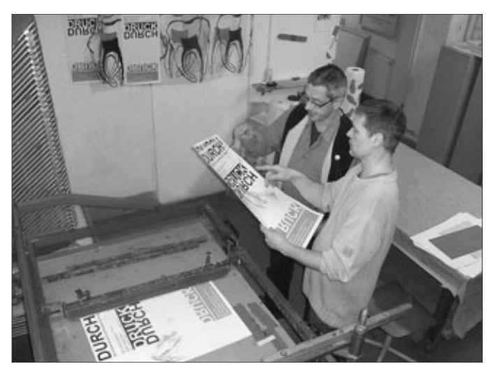
Am Casper-David-Friedrich-Institut beschäftigt man sich mit den verschiedenen Formen des Siebdruckes.

Attendorf. Der Verein zur Förderung von Kunst und Kultur in Attendorf lädt zur Eröffnung einer Ausstellung von Studierenden des Caspar-David-Friedrich-Instituts am heutigen Sonntag, 28. Februar, um 17 Uhr in die Galerie des Rathauses Attendorf ein.