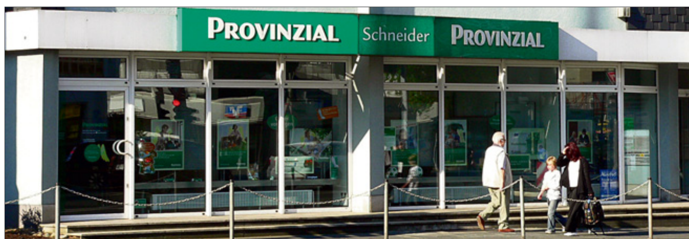
Zentral in Siegen an der Spandauer Straße 2 liegt die Provinzial-Geschäftsstelle, in der Carlo Schneider und seine vier Mitarbeiterinnen gern für die Kunden da sind.

Carlo Schneider: Beim Abschluss einer Zukunftssicherung sollte man unbedingt darauf achten, dass sie flexibel ist. Dass ich die Möglichkeit habe, die Beitragszahlungen zu unterbrechen oder etwas dazuzuzahlen, wenn ich mehr verdiene oder vielleicht geerbt habe. Wichtig ist auch, dass ich eine Berufsunfähigkeits-Zusatzversicherung einschließen, mir einen Teil des Kapitals auszahlen lassen oder im Todesfall Hinterbliebene absichern kann. Bei der Provinzial ist zudem kostenlos eine erhöhte Altersrente bei Pflegebedürftigkeit eingeschlossen. Die so genannte Dread Disease-Option ermöglicht im Falle bestimmter schwerer Krankheiten die steuerfreie Entnahme von Kapital.