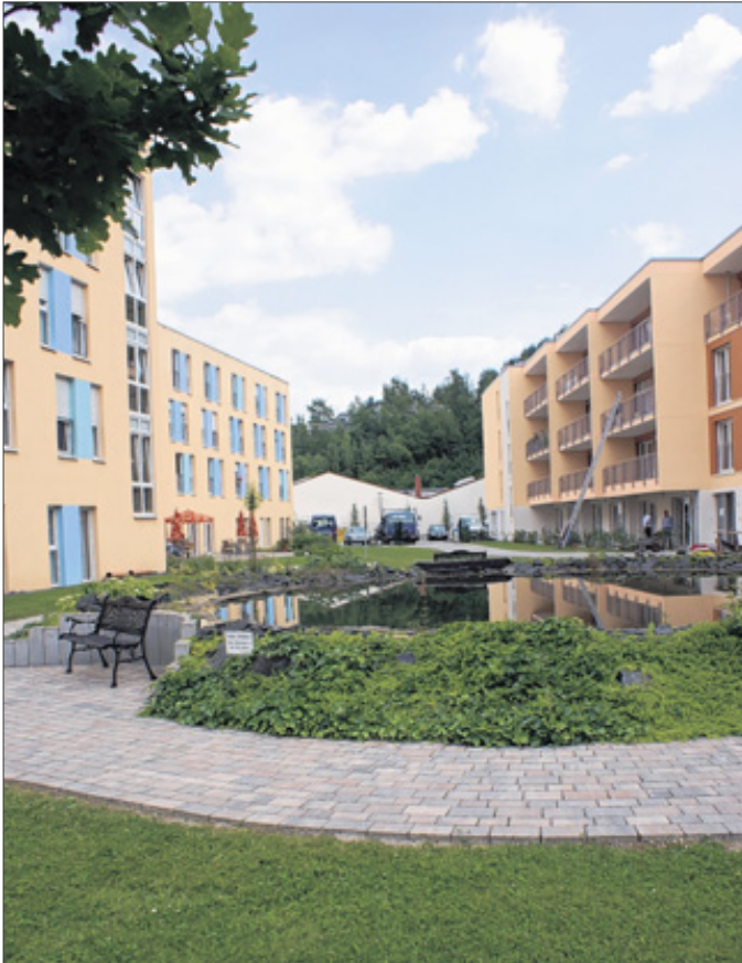
Haus 1 auf der linken Seite und der Neubau, Haus 2, ergänzen einander nicht nur optisch. Zwischen den Gebäuden liegt ein gepflegter Garten.

Im neuen Haus untergebracht sind eine Tagespflegeeinrichtung für zwölf Personen, eine vollstationäre Pflegegruppe, ebenfalls für zwölf Frauen und Männer und eine ambulante betreute Wohngemeinschaft mit zehn Plätzen (siehe ges. Bericht). Auch die 23 Eigentumswohnungen von 60 bis 80 Quadratmeter Größe sind fast samt