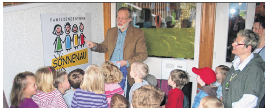
Das neue Schild „Familienzentrum Sonnenau“ ist da. Die Kinder freuen sich über den Namen ihres Kindergartens in Erndtebrück.

Eine Gruppe heißt „Vimmerby“ – hier in der schwedischen Stadt in der Provinz Kalmar län erblickte Astrid Lindgren im Jahr 1907 das Licht der Welt. Die zweite Gruppe nennt sich Lönneberga – ein Örtchen in der Gemeinde Hultsfred in Småland und bekannt durch die Erzählungen vom frechen Lausbub Michel. Die dritte Gruppe im Bunde ist „Bullerbü“ – aus