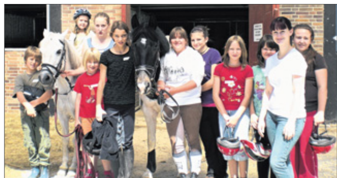
Mit den Schulpferden „Samurai“ und „Nepomuk“ freunden sich die Ferienkinder schnell an. Weitere Kurse bietet der Reitverein Hüttental nun um August an.

Reitverein bietet wieder Ferienspaß-Kurse an