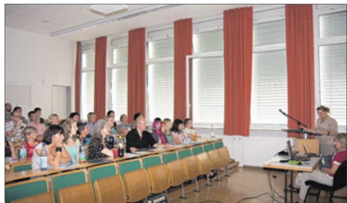
Pflegefachkräfte referierten jetzt über Fragen zum Wundmanagement, zu Blutvergiftung und Hirntod. Ihr Forum fand als dritter Siegener Tag der Intensivpflege und Anästhesie statt.

Siegen. Pflegefachkräfte referierten jetzt über das Thema Intensivpflege und Anästhesie. Ihr Forum zum Wissensaustausch fand am Diakonieklinikum Jung-Stilling in Siegen statt. Gesundheits- und Krankenpfleger stellten dort ihre Facharbeiten vor.