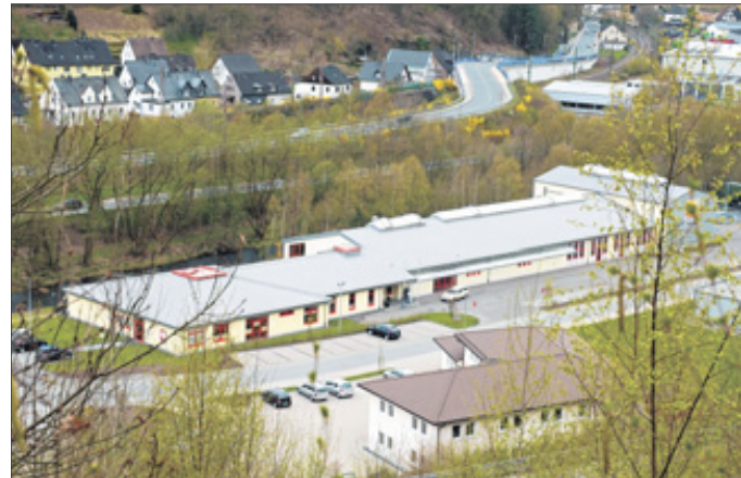
Seit drei Jahren steht das große Gebäude der Werthmann-Werkstätten auf dem ehemaligen Sachtleben-Gelände in Meggen.

Die dritte Werthmann-Werkstatt wurde seinerzeit erforderlich durch die Überbelegung in den Attendorfer Werk-