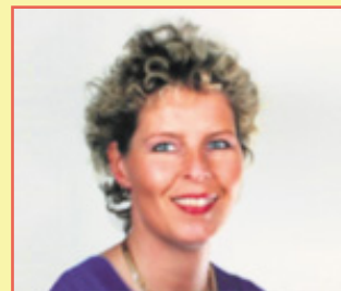
Möglichkeit, sich auf Dauer von der Nikotinsucht zu befreien oder Ihr Wohlfühlgewicht zu erreichen und auf Dauer zu halten.

Alleine in Deutschland, so die deutsche Krebshilfe sterben Jahr für Jahr mehr als 140.000 Menschen an den Auswirkungen der Nikotinsucht. Sagen auch Sie „ Tschüss Zigarette “ und verabschieden sich von dem Glimmstängel. Durch die Hypnose wird Ihnen Rauchen völlig gleichgültig. Jetzt haben Sie die