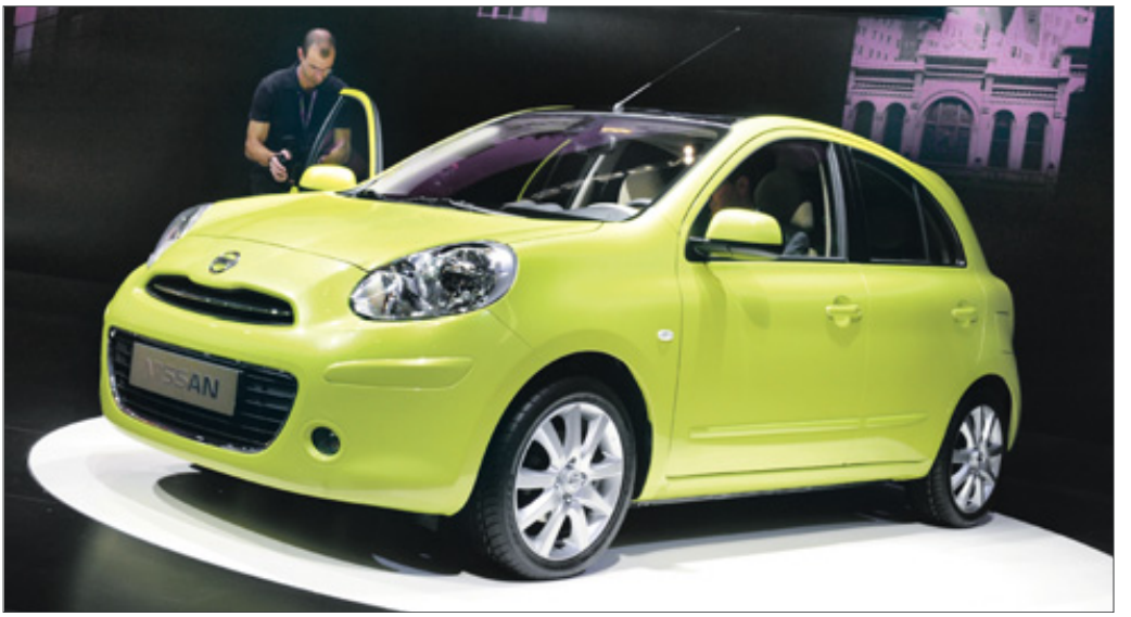
Jetzt beim Genfer Automobilsalon vorgestellt, kommt der neue Nissan Micra im Herbst nach Deutschland.

Beim Direktzurren wird die Ladung unmittelbar durch diagonal, horizontal oder schräg angeordnete Zurrmittel mit dem Fahrzeug verbunden. Diese Maßnahme ist die effektivste; allerdings müssen dafür nicht nur am Fahrzeug, sondern auch an der Fracht, entsprechende Befestigungsmöglichkeiten vorhanden sein.