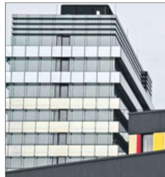
Die Optik sei ein positiver Nebeneffekt, so Landrat Paul Breuer. Reizvolle Ansichten bieten sich rund ums Hochhaus mit der Glasfassade.

Hochhaus Etage für Etage saniert. Passanten fiel dabei vor allem die neue Glasfassade ins Auge, die nach und nach von oben nach unten angebracht wurde. „Für die Fassade wurden 14 300 Quadratmeter Glasflächen montiert, im gesamten Haus 7700 Quadratmeter Tep-