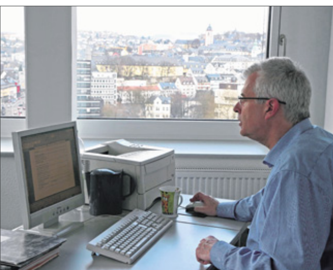
Ein Arbeitsplatz mit bester Aussicht auf Siegen – in Etappen ziehen die Kreishaus-Mitarbeiter aus dem IHW-Park zurück ins Verwaltungsgebäude an der Koblenzer Straße.

piche verlegt und Kabel in einer Gesamtlänge von 146 Kilometern montiert – das entspricht annähernd der Länge des Rothaarsteiges von Brilon bis Dillenburg“, machte Kreisdirektor Frank Bender die Dimensionen der Sanierung deutlich. „Wir hatten einen sehr engen und strammen Zeitplan und ich bin stolz darauf, dass wir ihn sehr gut eingehalten haben“, so Bender.