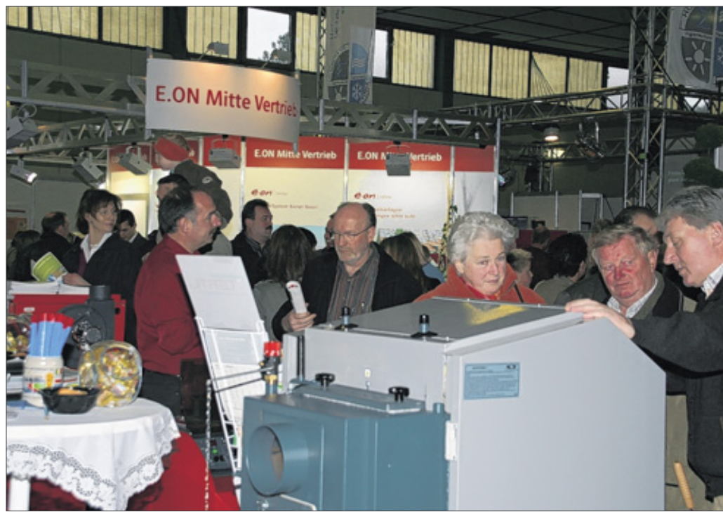
Ob Neubau, Umbau, Renovierung oder Modernisierung – bei der Dill-Bau-Expo bekommen die Messebesucher am kommenden Wochenende vielfältige Informationen.

Die Ausstellung wendet sich an alle, die modernisieren und das Haus oder in die Wohnung auf Vordermann bringen wollen, Personen, die jetzt ihren Traum von den eigenen vier Wänden verwirklichen wollen oder die eine Immobilie als Kapitalanlage oder als Altersvorsorge sehen. Angesprochen sind auch alle, die umweltverträglich und energiesparend bauen und die Angebote vergleichen wollen. Zum Thema ökologisches Bauen wird unter anderem gezeigt, wie sich Regenwasser für den Haushalt nutzbar machen lässt, wie Wasser mit Hilfe einer