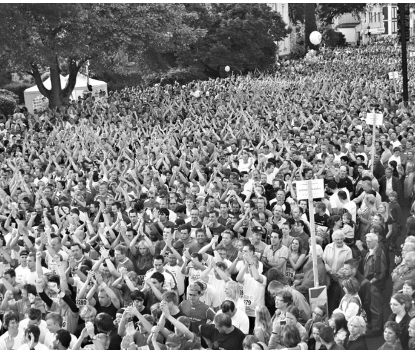
Der siebte Siegerländer Firmenlauf wird am 18. Juni stattfinden. Und dabei sollen wie im vergangenen Jahr wieder über 8000 Freizeitläufer an den Start gehen. Damit ist die Veranstaltung an der Obergrenze angekommen.