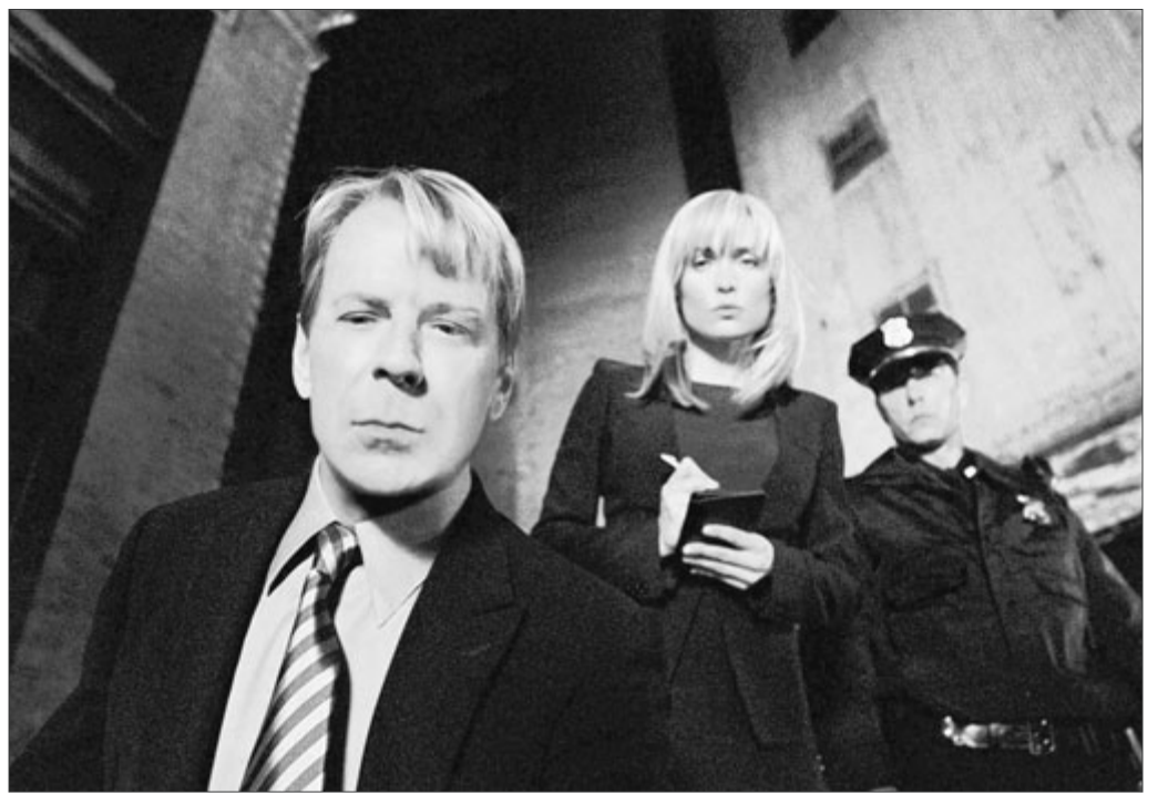
Na, erkannt? In Surrogates ist nicht nur Bruce Willis verjüngt und trägt wieder eine Haarpracht, fast die gesamte Menschheit lebt ein anderes Erscheinungsbild.

Dass Second Life und Co. reichlich Inspirationen und Vorlagen für Literatur und Film bieten würden, war abzusehen. Im ersten Monat des noch jungen Kino-Jahres konfrontieren aber bereits zwei Streifen den Zuschauer mit derartigen Zukunftsvisionen. Nach Gamer (SWA vom 10. Januar) malt Surrogates ein ähnlich fragwürdiges Szenario. Die Menschheit existiert im Alltag nur noch in einem Zweiten-Ich – den Surrogates.