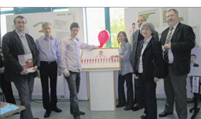
Im Rahmen der landesweiten „Aktionswoche Suchtprävention“ in Rheinland-Pfalz, fand in Steineroth jetzt erstmals die Ausstellung „Mindpower oder Zwangsjacke“ statt.

Ihr Küchenfachgeschäft seit 1989 · Untere Dorfstraße 165 · 57074 Siegen-Bürbach Telefon 0271/64635 · siegen@kueche-co.de