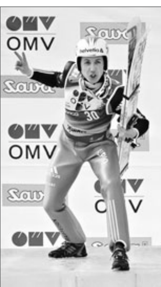
Und nochmal „Gold“ für Simon Ammann: Der Schweizer siegte bei der Skiflug-WM.

Planica. Simon Ammann hat seine perfekte Saison mit dem Weltmeistertitel im Skifliegen gekrönt. Nach zweimal Olympia-Gold und dem Gesamtweltcup-Sieg holte der Schweizer auch in Planica mit 935,8 Punkten Gold. Platz 2 belegte Gregor Schlierenzauer (Österreich) vor dem Norweger Anders Jacobsen. Bester Deutscher war Michael Uhrmann auf einem sehr enttäuschenden 19. Platz. Heute findet zum Abschluss der Saison die Teamentscheidung statt, in der Deutschland eine WM-Medaille gewinnen will. (sid)