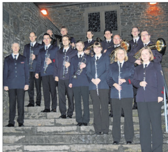
Eine kleine Besetzung aus Musikerinnen und Musikern des Musikzugs der Freiwilligen Feuerwehr Olpe, eine so genannte Banda, wird Ende Februar gemeinsam mit dem WDR-Orchester in Düsseldorf auf der Bühne stehen.