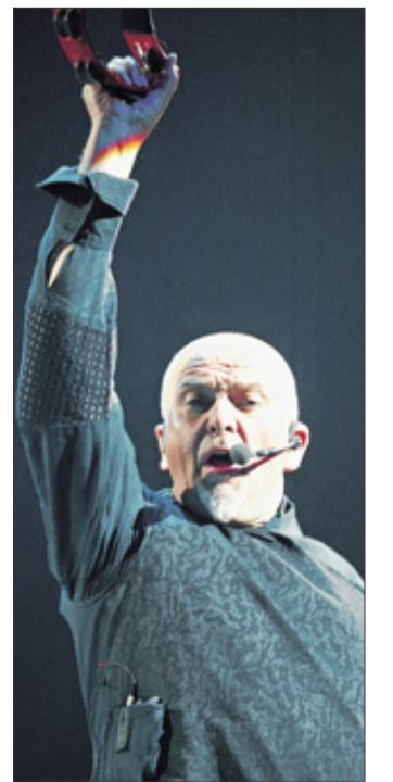
Peter Gabriel interpretiert grandios auf seinem zwölf Songs anderer Künstler.

► Das Fazit: An Scratch my Back scheiden sich die Geister - für die einen ist es ein famoses Album eines großen Künstlers, andere sehen in der Cover-Kompilation ein überflüssiges Werk. Die einen haben Recht, die anderen nicht. - 8/10 bw