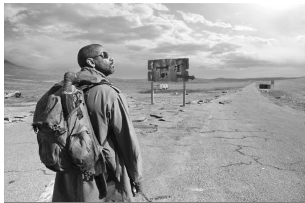
Willkommen in der Endzeit: Eli (Denzel Washington) ist einer der wenigen Überlebenden in der kargen und ausladenden Welt im Jahr 2044.