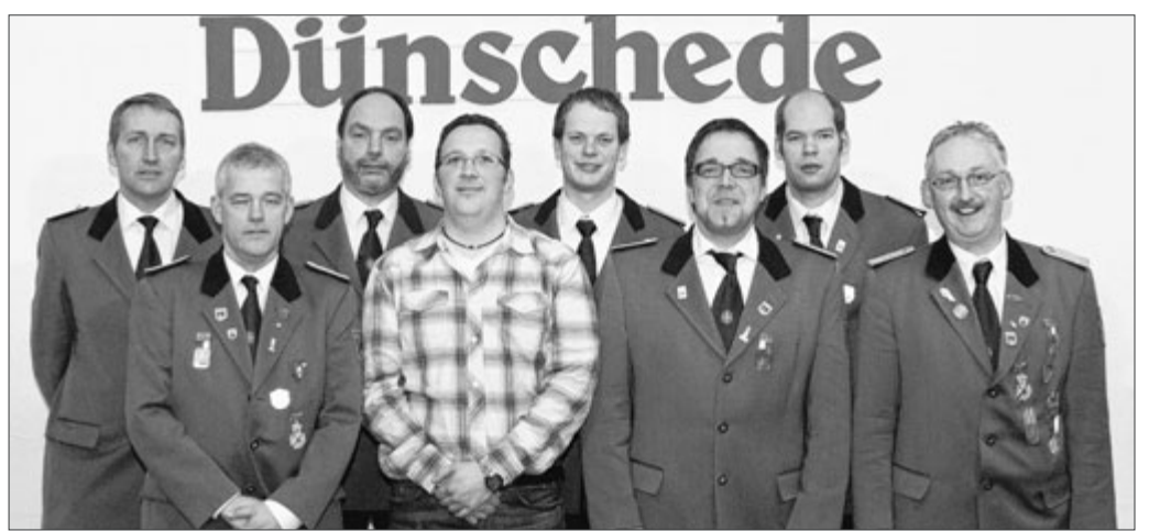
Die St.-Sebastianus-Schützenbruderschaft Dünschede ist gut aufgestellt – und vergisst dabei auch nicht, ihren Mitmenschen in Not etwas Gutes zu tun.

Wer Interesse an der Spielmannsmusik hat kann sich unter ☎ (0 27 21) 5 02 50 oder Mobil (01 60) 8 10 55 89 melden.