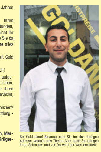
Bei Goldankauf Emanuel sind Sie bei der richtigen Adresse, wenn's ums Thema Gold geht! Sie bringen Ihren Schmuck, und vor Ort wird der Wert ermittelt!

kaufen“, sagt Weber. Gold habe in den letzten Jahren einen rasanten Preisanstieg hingelegt. Sie haben geerbt oder nur einfach mal Ihren Schmuckkasten aufgeräumt? Haben Sie Teile gefunden, die Sie schon lange nicht mehr tragen oder die nicht Ihr Stil sind? Oder Sie wissen gar nicht, welche Werte Sie da haben und was „echt“ ist. Bringen Sie uns gerne alles vorbei, wir helfen Ihnen bei der Orientierung. Kundensturm in Siegen. Juwelier Emanuel kauft Gold zu Höchstpreisen! Unser Tipp: Juwelier Emanuel. Jeder Weg lohnt sich! Ob geerbt oder einfach mal den Schmuckkasten aufgeräumt, viele Kunden haben doch so einige Schätzchen, die sich nicht mehr tragen, aber nach wie vor ihren Wert besitzen. Diesen Kunden bieten wir die Möglichkeit, sich über diese Werte fachkundig zu informieren. 100 % seriös – diskret – sofort & unkompliziert! Der Höchstpreis ist garantiert! Kostenlose Wertermittlung – bei uns zahlen Sie KEINE Gebühren. Wir kaufen Gold in jedem Zustand sofort! Defekter Schmuck, Bruchgold, Altgold, Münzen, Markennuhren, Brillantschmuck, Ferrero Münzen, Krüger- und Gedenkmünzen, Zahngold!