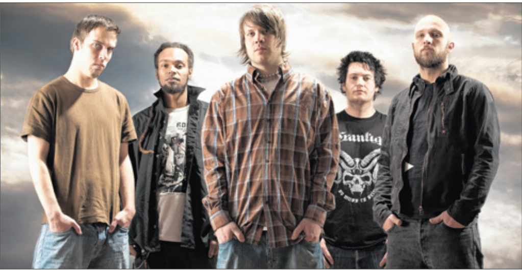
Mit den „Emil Bulls“ (Foto) und „Itchy Poopzki“ stehen gleich zwei große Namen auf der Bühne des „Feel The Pressure“-Festivals in Betzdorf.

„Feel The Pressure“-Festival mit „Emil Bulls“ und „Itchy Poopzki“