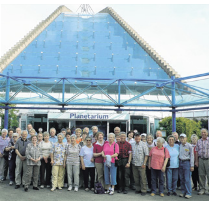
Die Wanderfreunde „Siegperle“ Kirchen waren in letzter Zeit viel unterwegs und planen auch jetzt schon wieder einige Ausflüge.

einem Gasthaus eine Mittagsrast genommen werden kann. Diverse für Kinder und Erwachsene gleichermaßen erlebnisreiche Haltepunkte sollen den Teilnehmern die Wied und ihr Tal naturkundlich näher bringen. Treffpunkt ist der Parkplatz am Raiffeisen-Markt in Altenkirchen-Leuzbach um 10 Uhr. Die Teilnahme ist auf etwa 30 Teilnehmer begrenzt. Es wird deshalb um Anmeldung unter ☎ (0 26 81) 98 99 92 gebeten.