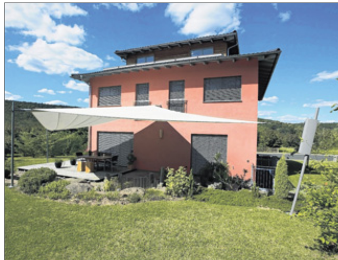
Ein Sonnensegel im Außenbereich bietet großflächigen Schutz vor der Sonne und setzt moderne architektonische Akzente – ein schöner Trend für das Frühjahr.

Die Segel setzen mit ihrer Eleganz und Gestaltungsvielfalt architektonische Akzente und sind vielseitig rund ums Haus einsetzbar. Beim Grillfest oder der Cocktailparty machen sie ebenso eine gute Figur wie beim Relaxen mit der Familie. Mittlerweile gibt es zahlreiche Variationsmöglichkeiten. Neu in dieser Saison sind größere Brei-