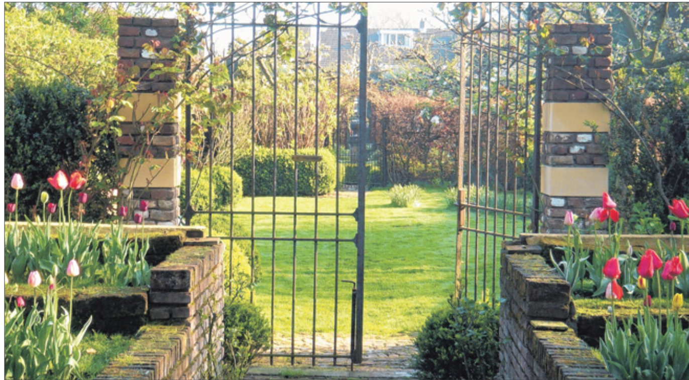
Türen und Tore auf für den Frühling: Die ersten warmen Tage sorgen auch in Wittgenstein für Farbe in den Beeten und machen Lust auf Gartenarbeit.

Ganz anders sieht das im Garten aus. Denn dort ist das Großreinemachen zu Saisonbeginn der Garant für ein blühendes Paradies im Sommer. Mehr noch: Vernachlässigung rächt