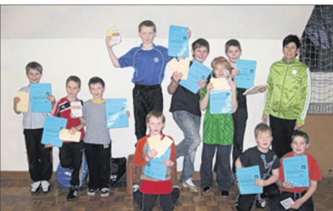
Mittels verschiedener Übungen lernten die Jungen sich selbst zu behaupten.

Neunkirchen. Im Januar und Februar führte der Turnverein Neunkirchen 1911 einen Kurs für Selbstbehauptung und Selbstverteidigung für Jungen durch.