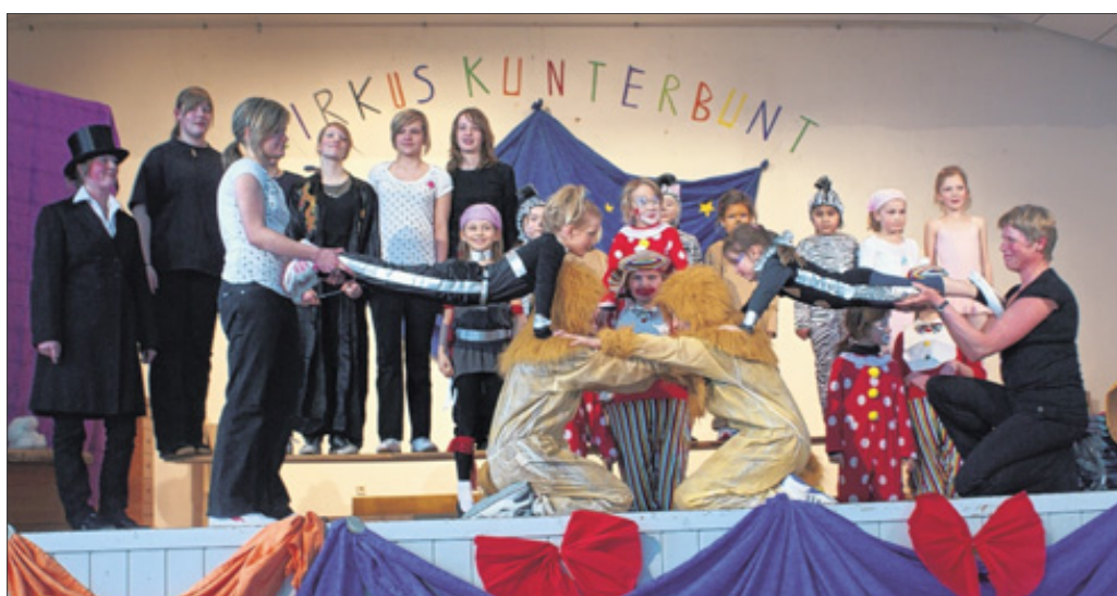
Als Clowns und Akrobaten agierten die kleinen und großen Turner vom TV Salchendorf auf der Bühne der Mehrzweckhalle.

Neunkirchen-Salchendorf. Zu einer kunterbunten Zirkusveranstaltung der besonderen Art hatten kürzlich die Übungsleiter der Kinder- und Jugendgruppen des TV Salchendorf eingeladen. Über 100 Kinder zeigten an diesem Nachmittag ihr turnerisches Können in einer voll besetzten Mehrzweckhalle. Eltern, Großeltern und Gäste waren zahlreich erschienen und begeistert.