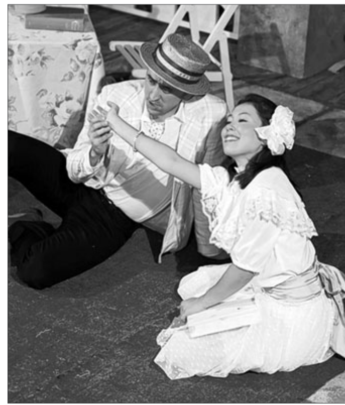
Das Tour de Force Theatre präsentiert Oscar Wildes Komödie auf eine eigene spezielle Weise, demnächst gibt es die englischsprachige Aufführung im Apollo-Theater.

Überhaupt spielen in diesem Buch neben der Liebe auch Literatur und Sprache eine große Rolle – wenn die Protagonisten selbst das Literarische zum Thema ihrer Dialoge machen, aber auch durch die unbändige Sprachlust der Autorin, die raffiniert, lakonisch, witzig und verspielt zu erzählen versteht und neue Freude weckt an der literarischen Form der Short Story. aro