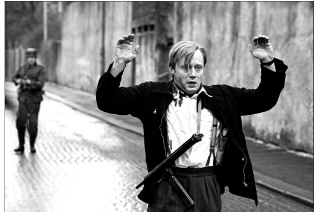
Max Manus (Aksel Hennie, r.) war die Galionsfigur des norwegischen Widerstandes gegen die Nazis. Der Film setzt ihm ein Denkmal, das nicht ganz so glatt poliert ist, wie man denken mag.

Kriegsfilme gibt es bekanntlich zu Genüge und meistens sind sie in der nationalsozialistischen Zeit angesiedelt. Das ist auch in Max Manus nicht anders. Doch wie schon bei Tage des Zorns stehen diesmal nicht Amerikaner, Franzosen oder gar Deutsche im Mittelpunkt, sondern Skandinavier. Max Manus erzählt die (mal mehr, mal weniger) wahre Geschichte des norwegischen Widerstandskämpfers. Zunächst freiwillig an der finnischen Front gegen die Russen im Einsatz, wehrt er sich später gegen die Besetzung seines Heimatlandes. Gemeinsam mit einigen Freunden will er die Bevölkerung mobilisieren, sich gegen die Deutschen zu stellen und die Herrschaft über das eigentlich neutrale Land nicht einfach zu akzeptieren. Was zunächst mit selbst gedruckten Propaganda-Schriften beginnt, entwickelt sich immer mehr zu einer echten Bewegung. Doch Max Manus (Aksel Hennie, r.) wird unvorsichtig und leichtsinnig, bis ihm die Nazis in seiner Wohnung auflauern. Er rettet sich mit einem Sprung aus dem Fenster, nur um sich schwer verletzt und von Nazis bewacht in einem Krankenhaus wiederzufinden. Doch sein Widerstandswille ist ungebrochen, ihm gelingt erneut die Flucht. In Schottland wird er ausgebildet, kehrt in seine Heimat zu-