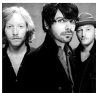
Mit ihrer Hymne „Mountains“ starten die drei Schotten von Biffy Clyro jetzt durch.

sive Rock („That golden Rule“) und Punk („Shock Shock“) wechseln. Manchmal klingen Biffy Clyro nach den Foo Fighters („Boooooom, Blast & Ruin“), manchmal nach The Strokes („Bubbles“). Und dann setzen die Balladen „God & Satan“ und „Many of Horror“ dem ganzen Album auch noch die Krone auf. – 8/10 Im Gegensatz zu Biffy Clyro sind The Temper Trap aus Melbourne eine junge Band. Ihr Debüt-Album Conditions ist Down Under bereits im Juli erschienen, bei uns sind die vier Musiker jetzt mit dem Song „Fader“ dabei, ein erstes Ausruferzeichen zu setzen. The Temper Trap spielen leichten, tanzbaren Rock. Der Einstieg („Love lost“ und „Rest“) klingt – mal abgesehen von dem viel zu hohen Gesang – wie eine B-Seite von Coldplay, was ja so schlecht schon mal nicht ist. Noch besser ist neben „Fader“ der Song „Sweet Disposition“, der schon fast zu leicht und ungezwungen klingt. Aus dem Rahmen fällt das sperrige, sechs Minuten lange und doch am Ende famose „Soldier On“. Dritter Anspieltipp des Albums ist „Science of Fear“. – 7/10 bv