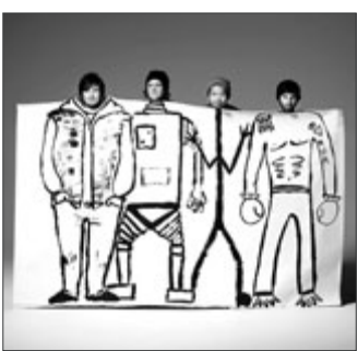
The Temper Trap aus Melbourne spielen leichten, tanzbaren Gitarren-Rock.

Außergewöhnliche Alben erfordern ungewöhnliche Maßnahmen. Eigentlich sollten ja an dieser Stelle nur brandneue Platten vorgestellt werden und eigentlich auch immer nur eine einzige. Doch manchmal erscheinen hervorragende Bands ganz plötzlich auf der Bildfläche, die bislang in Deutschland nur wenig bekannt waren. Und da sollte eine Ausnahme von der Regel einfach mal drin sein, gerade bei solch bemerkenswerten Gruppen wie Biffy Clyro und The Temper Trap.