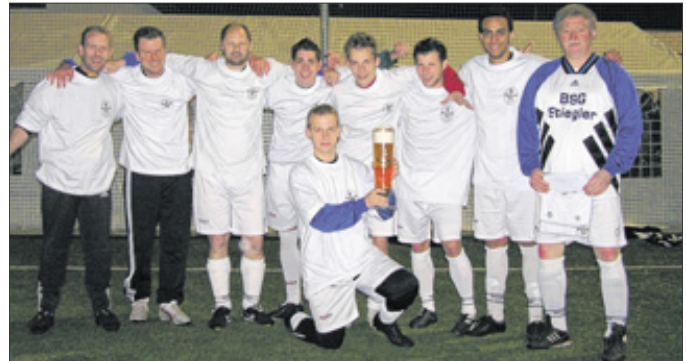
Sieger der Erzquell-Soccer-Night des VfB Wilden wurde die BSG Stiegler.