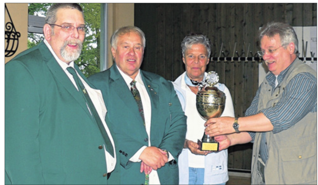
Freude bei den siegreichen Schützen: In Olpe holten jetzt knapp 300 Grünröcke das Kreispokalschießen auf der Anlage „Am Ümmerich“ nach.