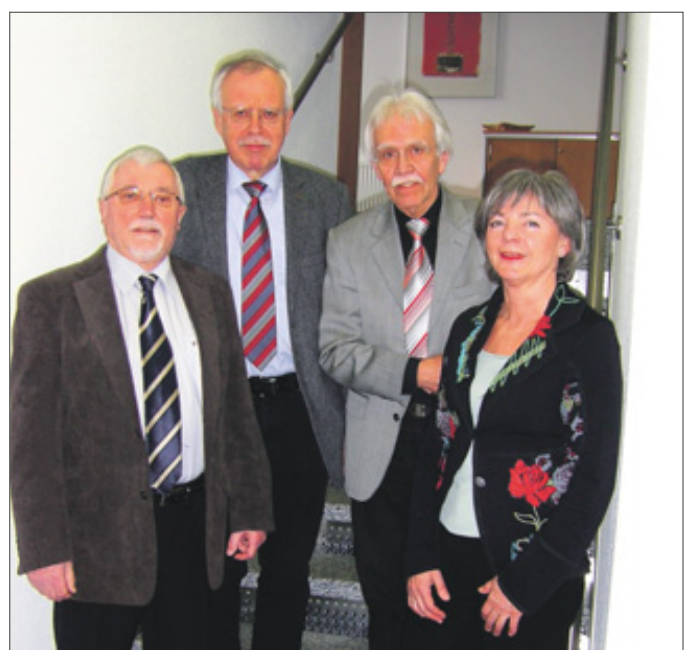
Das ehrenamtliche Team der Bürgerstiftung Kreuztal ist hoch motiviert und geht mit großem Tatendrang an die Arbeit.

rer Stiftung ist auf Kreuztal konzentriert,“ erläuterte Althaus weiter.