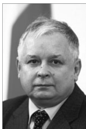
Polens Staatspräsident Lech Kaczynski ist bei einem Flugzeugabsturz in Russland ums Leben gekommen.

Smolensk/Warschau. Der polnische Präsident Lech Kaczynski ist am Samstag bei einem Flugzeugabsturz im russischen Smolensk ums Leben gekommen. Mit ihm starben Dutzende polnische Persönlichkeiten, ein Teil der Elite des Landes. Unklar ist die Zahl der Opfer. Wie die russische Nachrichtenagentur Itar-Tass berichtete, fanden alle 132 Menschen an Bord den Tod. Nach polnischen Angaben waren 88 Menschen in der Präsidentenmaschine TU-154 russischer Bauart.