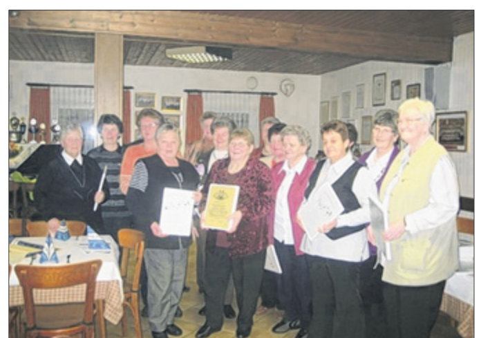
Zahlreiche Ehrungen gab es jetzt bei der Jahreshauptversammlung des Frauenchors Banfe im Vereinslokal Rothenpieler bei „Blass“.