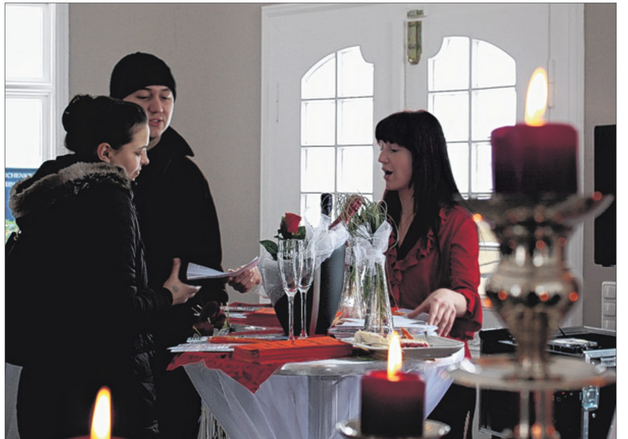
Informationen und Gespräche in gemütlicher Atmosphäre gab es hinreichend am vergangenen Sonntag bei der Hochzeitsmesse in den ältesten Räumlichkeiten von Bad Berleburg.