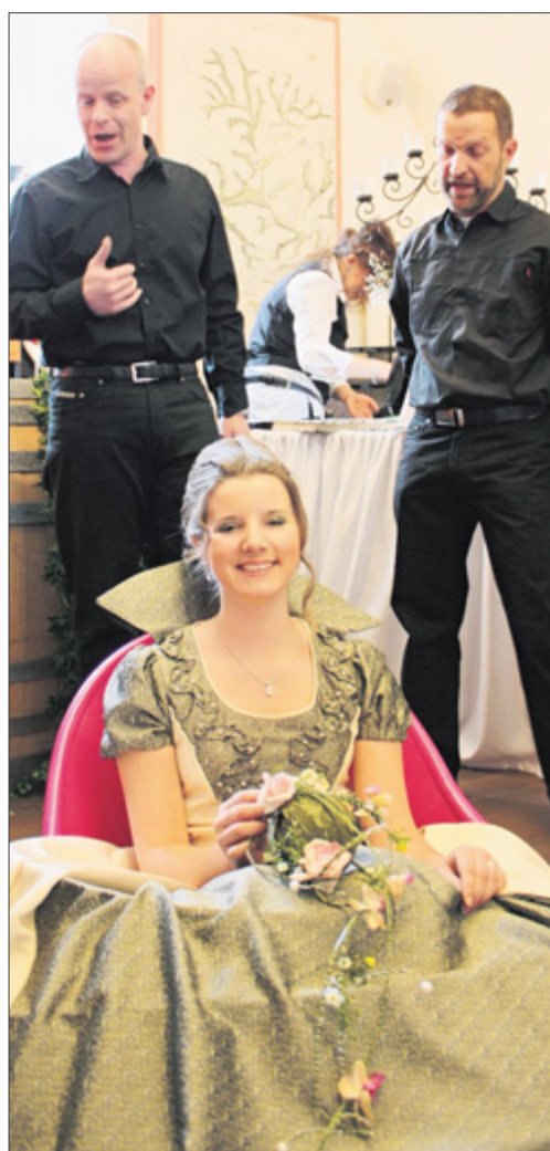
Ein Ständchen für die Braut in der Wanne sang der männliche Teil des Chores „Singsation“.

Die zweite Hochzeitsmesse im Bad Berleburger Schloss hat gezeigt, dass „Sag einfach Ja!“ leichter gesagt ist, als getan. Nicht nur der Antrag kostet Überwindung und eine gewisse Vorbereitung, sondern auch die Zeit danach steckt voller Herausforderungen. Mit den richtigen Ansprechpartnern, auch das hatte die Messe wieder einmal gezeigt, kann der Tag der Tage aber dennoch gelingen – so einfach kann „Ja“ sagen dann eben doch manchmal sein. db