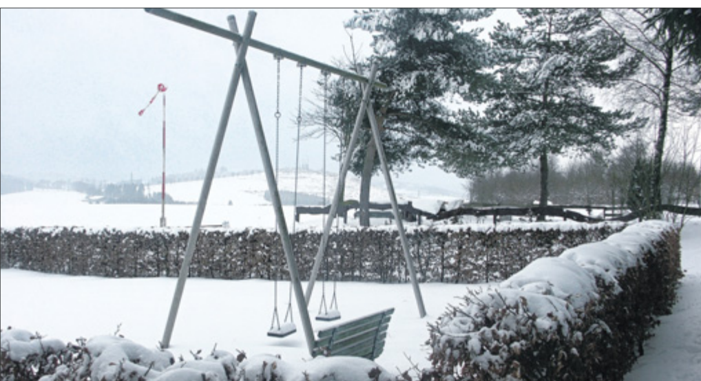
Der Dorfplatz in Schameder darf mit keinen weiteren Spielgeräten mehr bestückt werden. Was nun tun aber mit dem übrig gebliebenen Geld? Profitieren könnte der Spielplatz am Flugplatz.

Dorfplatz Schameder stand im Mittelpunkt der Diskussion