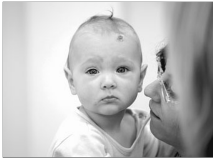
Die DRK-Kinderklinik möchte Familien in kranken und gesunden Zeiten ein guter Partner sein, dazu zählt die Elternbildung: Der „Kinderführerschein“ wird jetzt zum neunten Mal angeboten.

Siegen. Die Reihe zum „Kinderführerschein“ wird jetzt zum neunten Mal von der DRK-Kinderklinik Siegen mit Unterstützung der AOK angeboten. Neun Vorträge für Eltern zu Themen rund um die Gesundheit, Gesundheitsvorsorge und Erziehung sind vorgesehen. Ein Thema wird auch wieder in türkischer Sprache besprochen. Vorgesehen ist eine Fragestunde zum Thema Fieber: „Cocugum atesi var – ne olabilir ve ne yapmalı?“