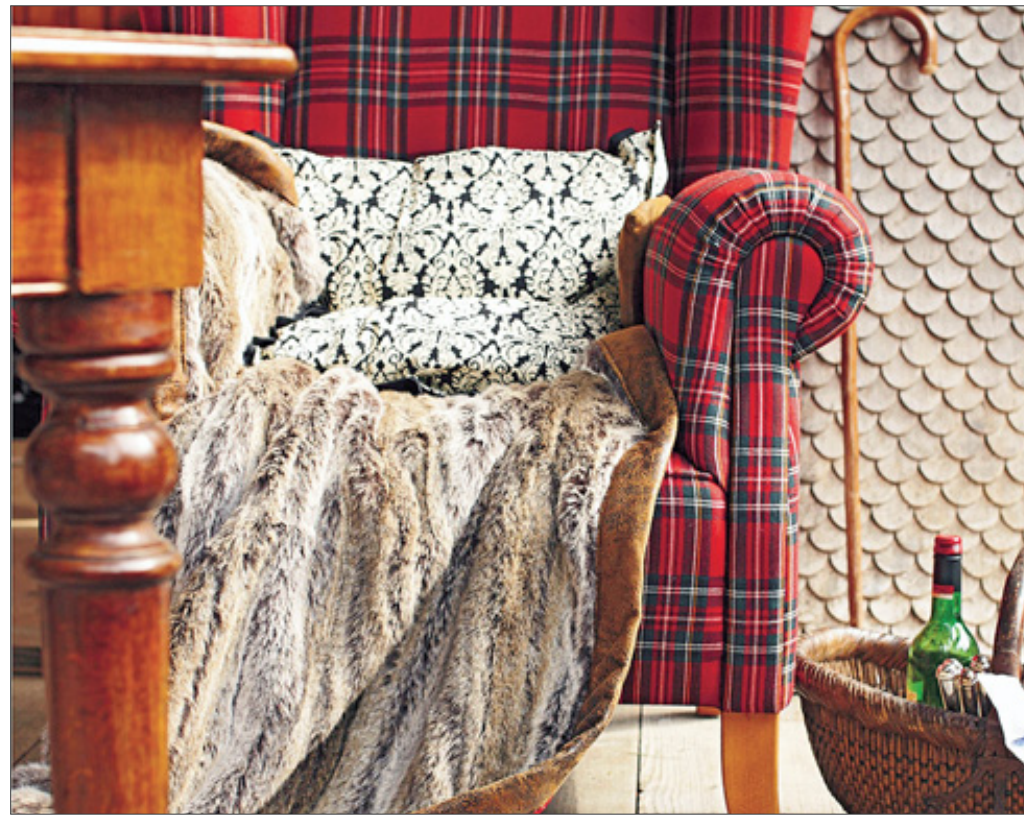
Typisch schottische Karostoffe passen gut zu klassischen Ohrensesseln.