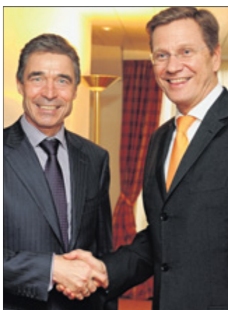
Guido Westerwelle sprach gestern bei der Sicherheitskonferenz mit NATO-Generalsekretär Anders Fogh Rasmussen.

München. Deutschland und die USA pochen auf ein Einlenken der iranischen Regierung im Streit um das Atomprogramm des Landes. Bundesaußenminister Guido Westerwelle (FDP) kritisierte am Samstag auf der Münchner Sicherheitskonferenz, der jüngste Vorschlag Teherans reiche nicht aus. Der Sicherheitsberater von US-Präsident Barack Obama, James Jones, drohte der iranischen Regierung mit weiteren Sanktionen. Auch der russische Außenminister Sergej Lawrow sagte, es sei „absolut inakzeptabel“, dass der Iran Atomwaffen bekomme.