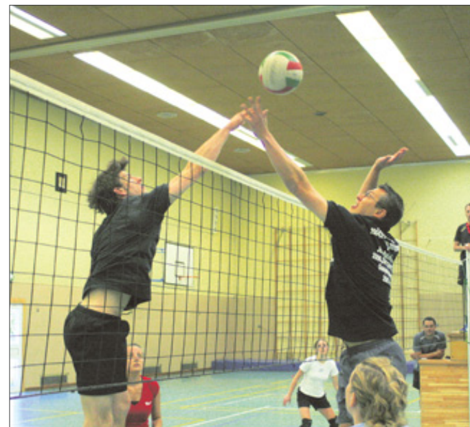
Am Donnerstag auf hartem Hallenboden (linkes Bild), gestern dann auf weichem Sand (rechtes Bild): Die Volleyballer standen beim 43. Gauturnfest in Bad Berleburg gleich doppelt im Mittelpunkt.

Heute endet das Gauturnfest in Bad Berleburg, um 13.30 Uhr ist der Festnachmittag der letzte Höhepunkt einer tollen Veranstaltung. lex/vö/wette