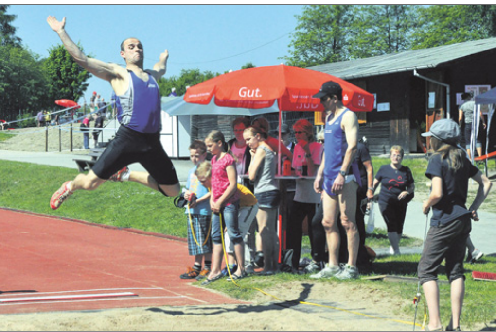
Das 43. Gauturnfest findet seit Donnerstag auf den Sportanlagen in Bad Berleburg statt. Mehr als 1000 Teilnehmer stellen sich dem Wettkampf. Weite Sprünge zeigten zum Beispiel die Sportler bei den Leichtathletik-Wettbewerben auf dem Stöppel.