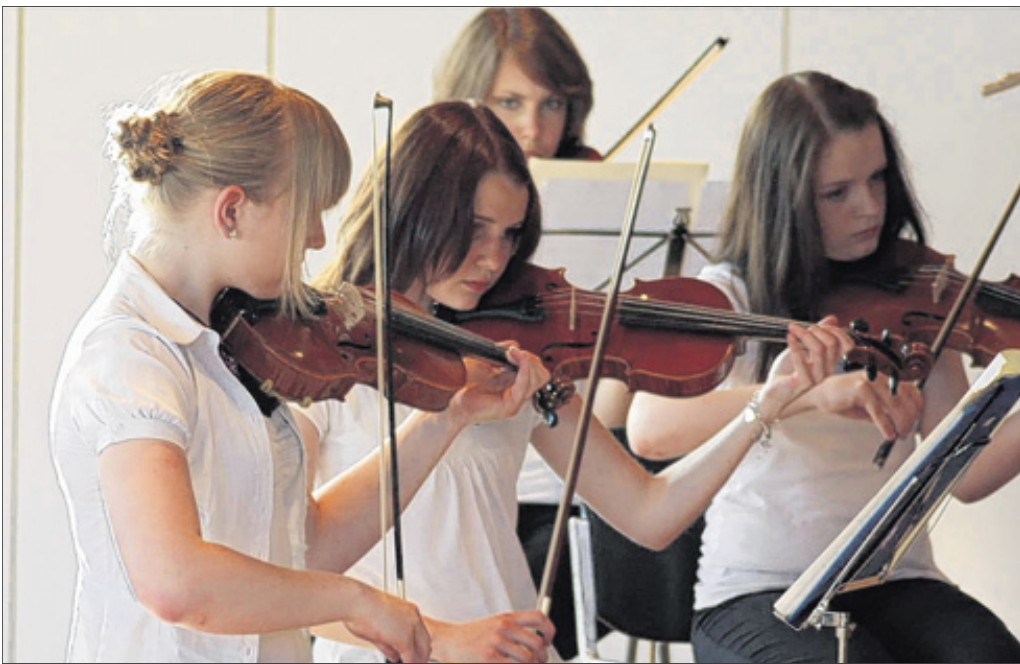
Auch diese jungen Geigerinnen zeigten beim Konzert in Finntrop, was sie bisher in der Musikschule gelernt haben.

Konzert der Musikschule Attendorn-Finntrop