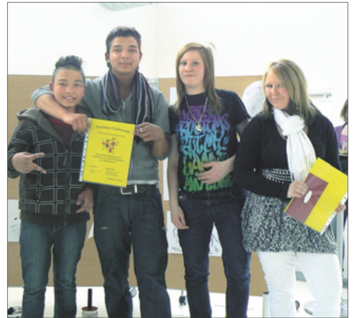
Das sind die Schultalente der Gemeinschaftshauptschule Attendorn.