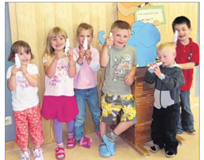
Es hat funktioniert: Die Nuss-Nougat-Creme ist in der Tube verschwunden. Die Jungen und Mädchen der AWO-Kindertagesstätte in Niederlaasphe zeigten jetzt großen Forscherdrang.