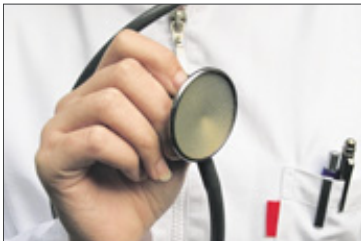
Ein wichtiger Programmpunkt der Gesundheitsmesse sind die Arztvorträge, die an beiden Tagen stattfinden, Mediziner des Kreisklinikums und des Sankt-Marien-Krankenhauses sind Ansprechpartner vor Ort.