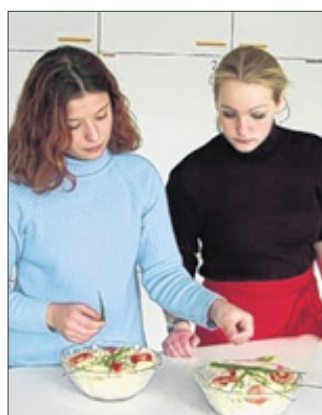
Hauswirtschaft und Gastronomie – das sind weitere Zweige des Berufskollegs Wittgenstein.