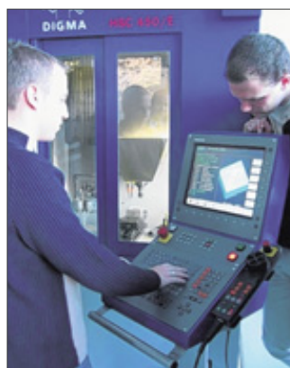
Das Berufskolleg bietet ein vielfältiges Angebot in allen Bereichen der beruflichen Bildung.