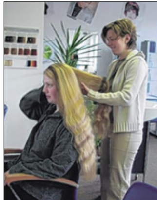
Zu den Ausbildungslehrgängen, deren schulischer Teil am Berufskolleg durchgeführt wird, zählt das Friseur-Handwerk.

Während in den vergangenen 15 Jahren beispielsweise im Altkreis Siegen und im Kreis Olpe die Ausbildungsstellen um über 50 Prozent zugenommen haben, stagnierte die Zahl der Ausbildungsstellen in Wittgenstein, obwohl auch diese Region in gleichem Maße am Wirtschaftswachstum Anteil hat.