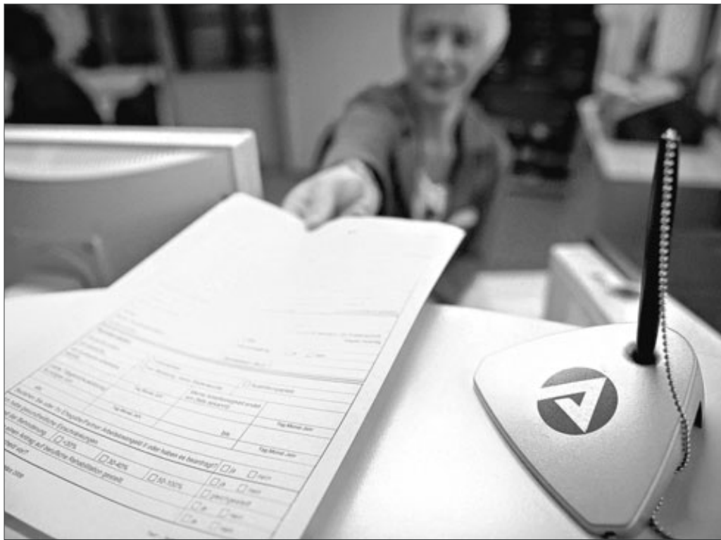
In den Kreisen Siegen-Wittgenstein und Olpe hat sich der Aufwärtstrend am Arbeitsmarkt fortgesetzt. So sind knapp 1000 Menschen weniger ohne Arbeit, als noch im letzten Monat.